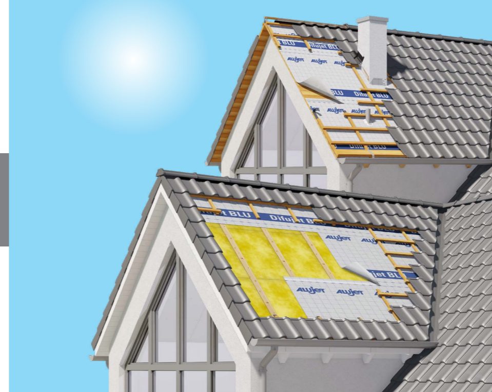
Anwendung mit Schalung