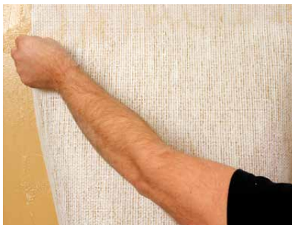
Aufkleben der Glasgewebetapete

Auch für Glasgewebetapeten kann CLAYFIX Lehmfarbe eingesetzt werden. Sie ist dabei Klebung und Anstrich in einem, beide Funktionen werden mit einem Arbeitsgang erreicht, frisch-in-frisch ausgeführt. Handelsübliche Dispersionskleber sperren die Untergründe mehr oder weniger ab, mit Lehmfarbe bleiben die Wände diffusionsoffen.