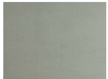
darauf DIE WEISSE