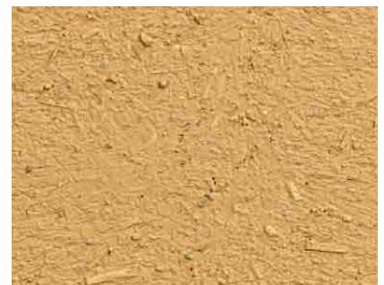
Struktur einer gut vorbereiteten Fläche aus Lehm-Unterputz