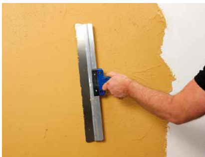
Abziehen mit dem Flächenspachtel