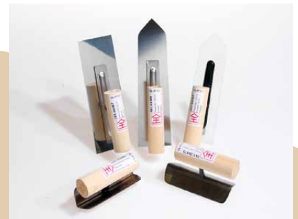
Japan-Glätter und -Feinputzkelle, feine Kunststoffkelle, Kehlen- und Kantenkelle