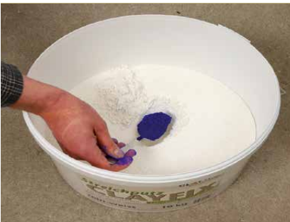
Pigment trocken zugeben