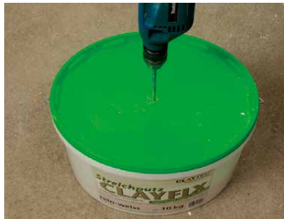
Bei geschlossenem Deckel einmischen