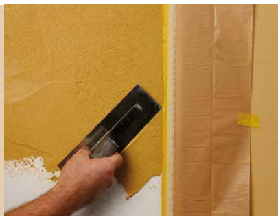
Auftrag der zweiten Farbe