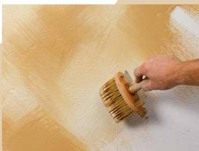
Auftrag der zweiten Farbe

Mit der Mehrfarbertechnik lassen sich besonders lebhaftere und farbenfrohe Effekte erzielen. Beim Ineinanderstreichen von mehreren Farben wird frisch-in-frisch gearbeitet. Die Streichbürste wird abwechselnd in zwei oder mehrere Eimer getaucht.