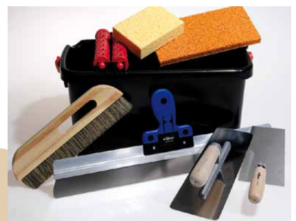
CLAYTEC bietet Japankellen, Schablonen und anderes ausgewähltes Profiwerkzeug an.

Mit dem Flächenspachtel (Rakel) können Putzgrate unmittelbar nach dem Auftrag gut abgezogen werden. Werden in einem Raum Wände und Decke verputzt, so beginnt man