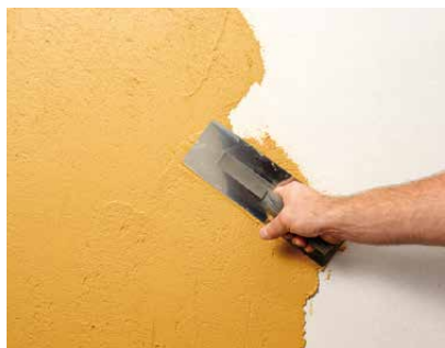
Aufziehen mit dem Glätter