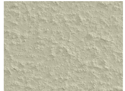
Struktur einer gut vorbereiteten Gipskartonplattenfläche

Vorsicht bei alten Gipskartonplatten! Die Kartonage kann vergilbende Stoffe enthalten, die durchschlagen.