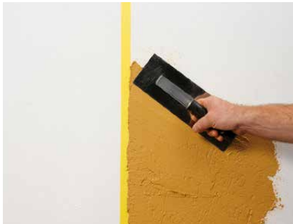
Auftrag der ersten Farbe an das Klebeband

Anders als andere Farbtöne kann YOSIMA WE 0 nach dem Trocknen nicht nur mit einem weichen Schwamm, sondern auch mit einem orangenen Schwamm-brett freigewischt werden. Bei diesem Arbeitsgang kann die Fläche sogar noch nachgerieben werden.