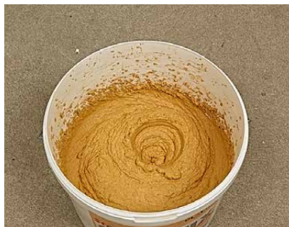
Nach 30 Minuten kräftig durcharbeiten, das Bild zeigt die verarbeitungsfertige Konsistenz