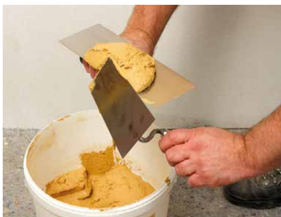
Entnehmen des Mörtels

Der Mörtel kann auch mit der Maschine angespritzt werden. Meist beschränkt sich das Anspritzen auf die Erleichterung des Mörtelantrags. Informationen und Kontaktadressen diverser Hersteller bietet unsere Internetseite www.claytec.de/service/maschinentechnik . Die dort genannten Ansprechpartner haben unsere Produkte mit den jeweiligen Maschinen im Praxistest erprobt und bieten somit kompetente Beratung.