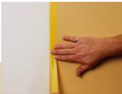
Erneutes Abkleben nach Trocknung