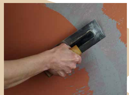
Auftrag der marmorierten Decklage