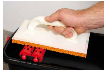
Ausrollen des Filzbretts

Für ein homogenes Ergebnis muss die Mörtelfläche zum Zeitpunkt der Bearbeitung gleichmäßig angetrocknet sein!