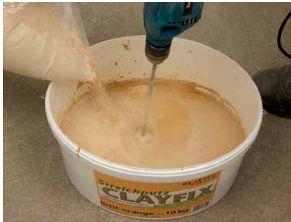
Einrühren des Eimerinhalts in Wasser

CLAYFIX Lehm direkt Lehm-Streichputz und Lehmfarbe wird in ca. 10l (dickerer einlagiger Anstrich) bis 15l (dünnere zweifacher Anstrich) sauberem Wasser per Bohrmaschine und Rührstab (Ø 100mm) mit möglichst hoher Drehzahl eingerührt, ca. 3 Minuten später nochmals gut durchgerührt. Nach 30 Minuten Ruhezeit wird das Material erneut 1-2 Minuten gut durchgerührt. Das Material wird in „breiiger“ Konsistenz verarbeitet, es darf nicht von der Streichbürste tropfen. Ein mehrmaliger Auftrag in dünnerer Konsistenz ist möglich. Während der Verarbeitung, insbesondere von CLAYFIX Lehm direkt Lehm-Streichputz muss der Putz immer wieder aufgerührt werden um ein Absinken des Korns zu verhindern. Bei längerer Standzeit muss der Bodensatz mit einem rostfreien Spachtel (z.B. Berner Kelle) vom Eimergrund gelöst werden. Streichputze und Lehmfarben können abgedeckt oder im geschlossenen Eimer 24 Stunden verarbeitbar gehalten werden. Alle Farben können untereinander gemischt werden.