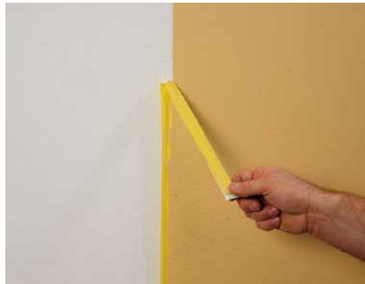
Abziehen nach dem Abwischen