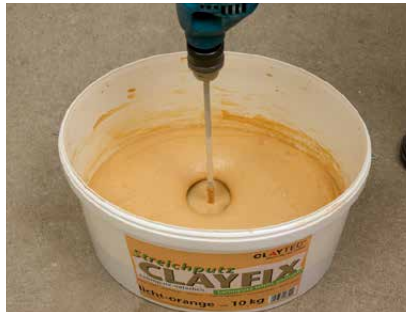
Nach 30 Minuten Quellzeit gut durchrühren