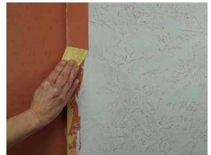
Abziehen scharfer Winkel

Auf Fleckspachtelungen kann eine tieffarbige, glänzende und gut geschützte Oberfläche mit Kanauberwachs-Emulsion erreicht werden. Dazu ist keine Vorbehandlung mit Tiefengrund notwendig. Die Emulsion wird sehr behutsam mit dem Schwamm aufgetragen, nicht eingerieben. Nach dem Trocknen können einzelne Stellen nachbehandelt werden. Zusätzliches Polieren erhöht den Glanzgrad.