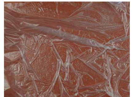
Geknüllte Folie auf Spachelfläche

Lehm-Farbspachtel wird nicht wie Kalkspachtel verarbeitet! Lehm-Farbspachtel wird weder „verpresst“ noch „gebügelt“ sondern ohne Druck geglättet, bis die erwünschte Oberflächenoptik erreicht ist.