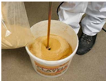
Einrühren des Eimerinhalts in Wasser. Danach 30 Minuten quellen lassen.

Zur Erzielung farbiger Akzente und Effekte können auch Pigmente in die feuchte Putzoberfläche eingearbeitet werden (Arbeitsprobe!).