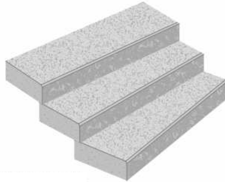
Blockstufe radial versetzt