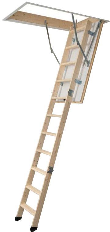
Kompakte Bodentreppe zum Einstiegspreis