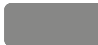
Graualuminium RAL 9007