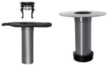
Ablauf / Sanierungsablauf

(Alle Angaben sind Richtwerte und ohne Gewähr)