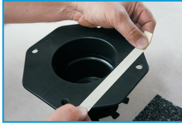
2. Schnittlinie herstellen