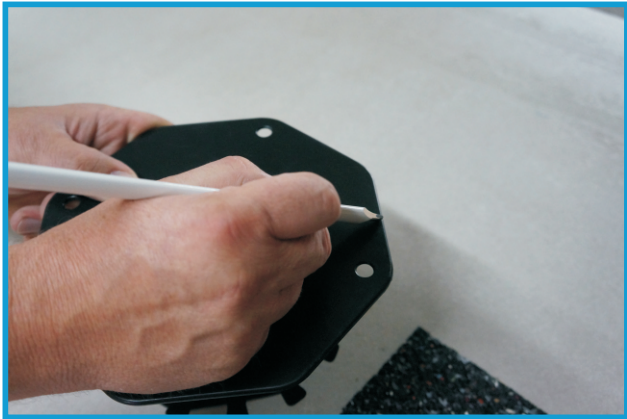
1. Schnittlinie anzeichnen