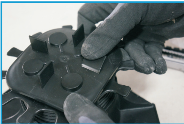
4. Fugenstege nach Bedarf abbrechen