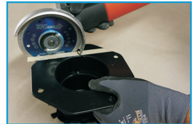
3. TSL entlang der Schnittlinie abtrennen