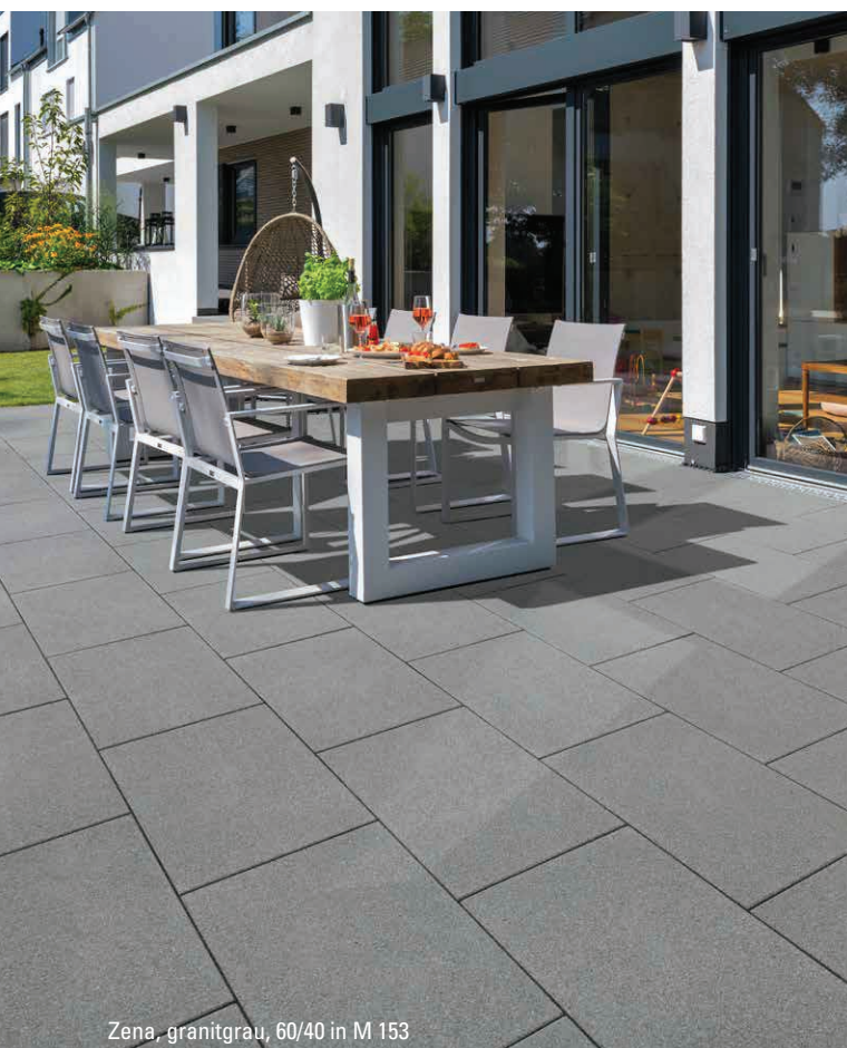
Zena, granitgrau, 60/40 in M 153