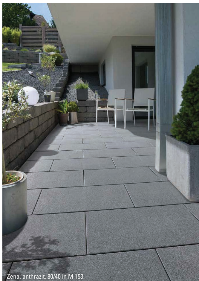
Zena, anthrazit, 80/40 in M 153