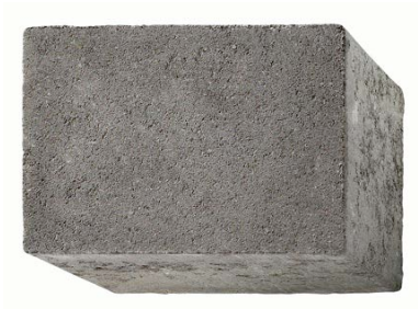
24 x 16 x 14 cm