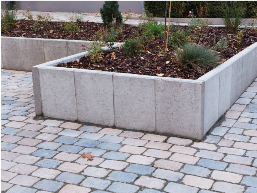
80 x 45 x 40 x 8 cm Grau