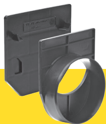
Stirnplatten mit und ohne Stützen

H1: 110 für MEAGARD II S/M/E Rinne, 115 für MEAGARD II G Rinne