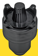
Ablaufanschluss mit Schmutzfang und Geruchsverschluss