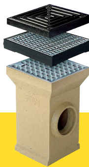
MEAGARD Hofablauf – die ideale Punktentwässerung für Ihren Hof