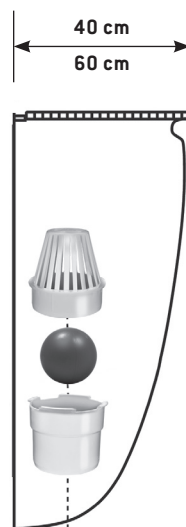
Montage der Geruchssperre MEASTOP für Lichtschächte Breite 40 oder 60 cm