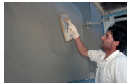
PCI Nanocret FC – Der zertifizierte Betonspachtel für die Betoninstandsetzung.