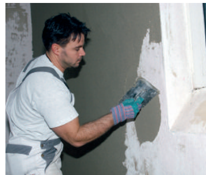
PCI Pericret lässt sich sehr geschmeidig verarbeiten - in Schichtdicken von 3 bis 50 mm.