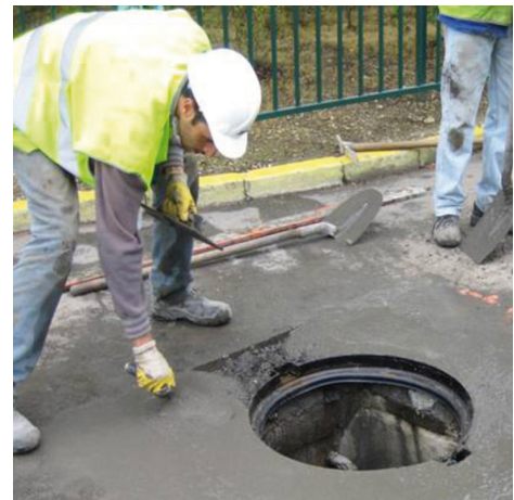
Einbetten eines Schachtringes mit PCI Repafast Tixo