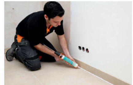
Elastisches Schließen von Boden-Wand-Fugen mit PCI Silcoferm S ohne störende Geruchsbelästigungen während und nach der Verarbeitung.