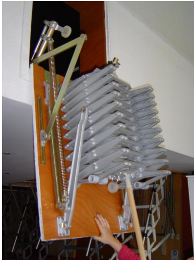
6) Zugstab hier einhängen...

6) connect operating pole to concertina stair