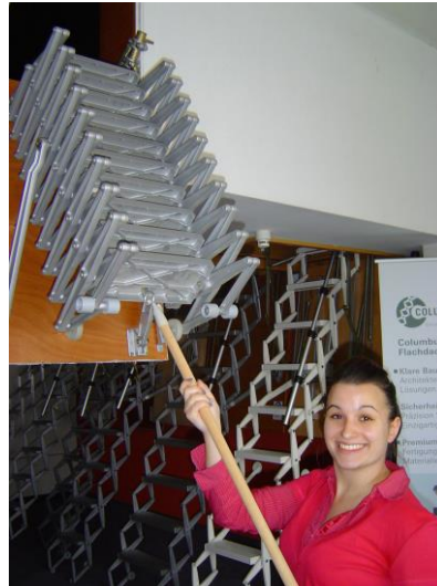
7) Scherentreppe ausziehen...

6) connect operating pole to concertina stair