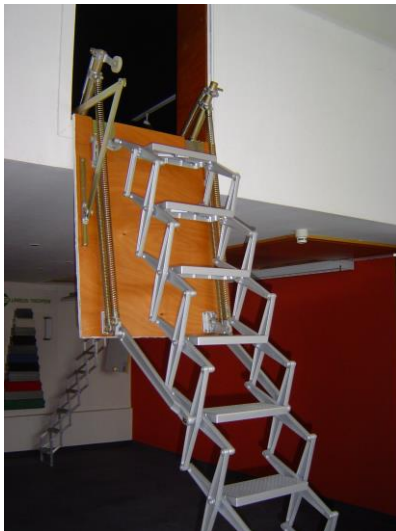
9) Scherentreppe fest am Boden aufsetzen...

8) remove operating pole, pull down concertina stair by hand