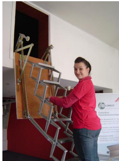
10) festhalten beim Auf- und Absteigen...

9) set concertina stair sure on the floor