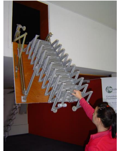
8) Zugstab aushängen, Treppe von Hand nach unten ziehen..

7) pull down concertina by operating pole