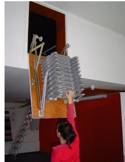
11) zum Schließen, Scherentreppe von Hand nach oben schieben

10) hold tight while climbing up and down