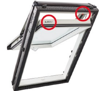
Baureihe 7 Hochschwingfenster