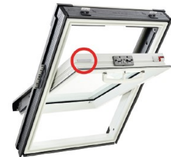
Baureihe Roto Q Schwingfenster