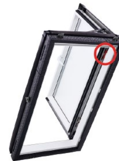
Baureihe 8 / 3 Wohndachausstieg