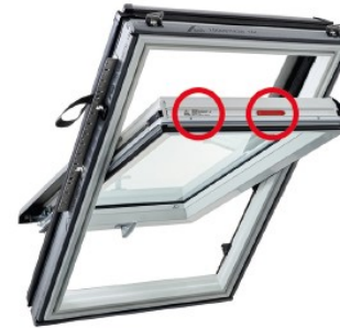
Baureihe i8 / 8 / 6 Klapp-Schwingfenster / Schwingfenster

Je nach Baureihe / Dachfenster-Typ befindet es sich an verschiedenen Positionen und das Dachfenster muss ggf. in die Putzstellung gebracht werden.