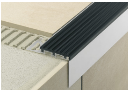
Schlüter®-TREP-B mit Schlüter®-TREP-TAP