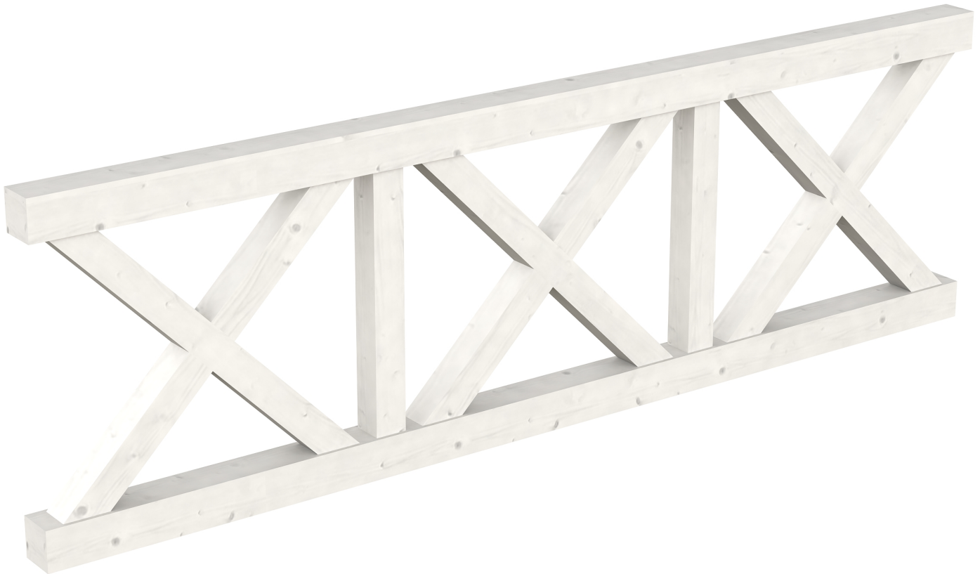
Produktbild AK-Brüstung 270cm