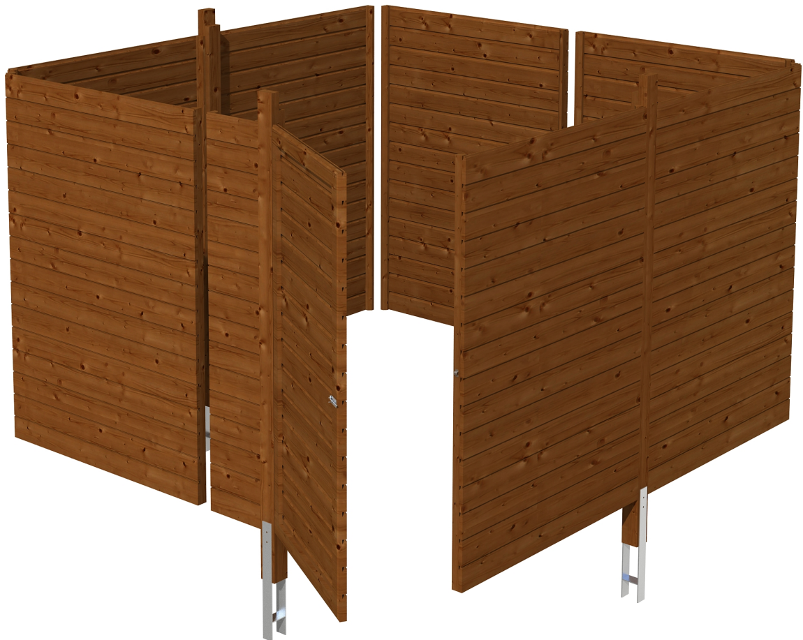
Produktbild Abstellraum C2