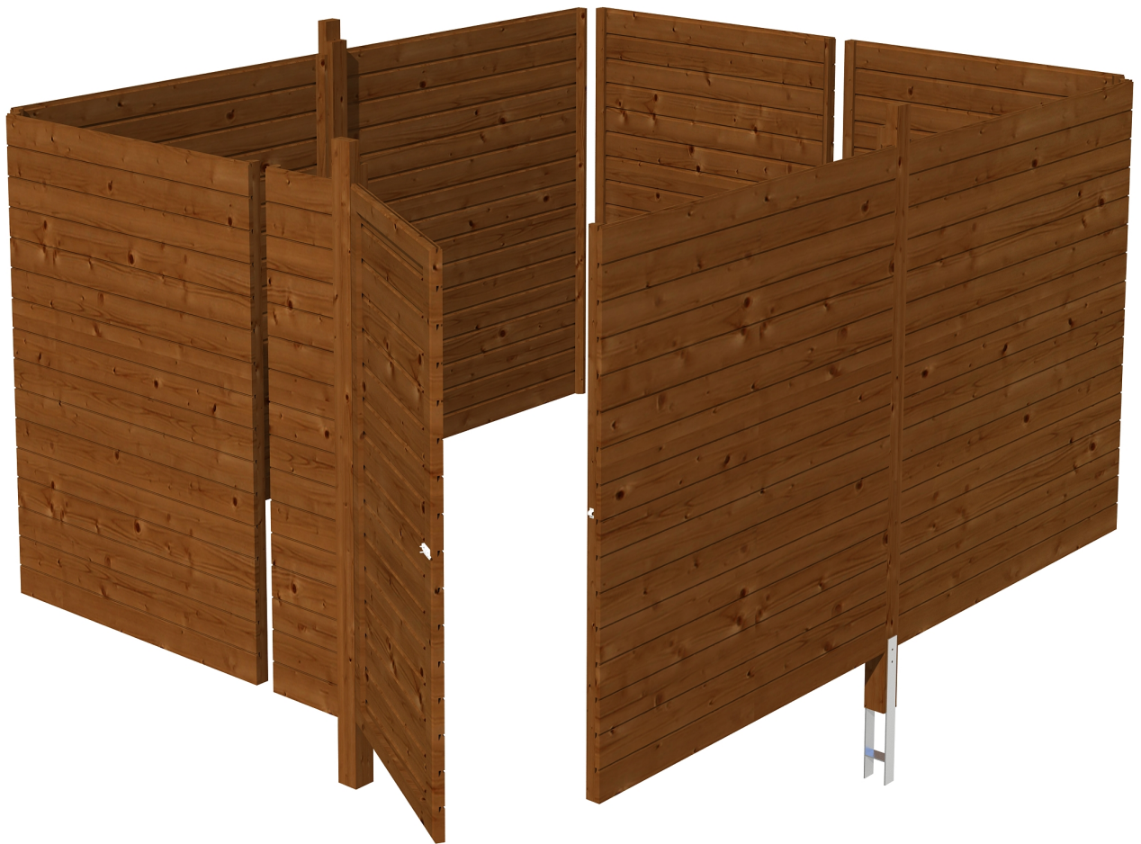
Produktbild Abstellraum C4