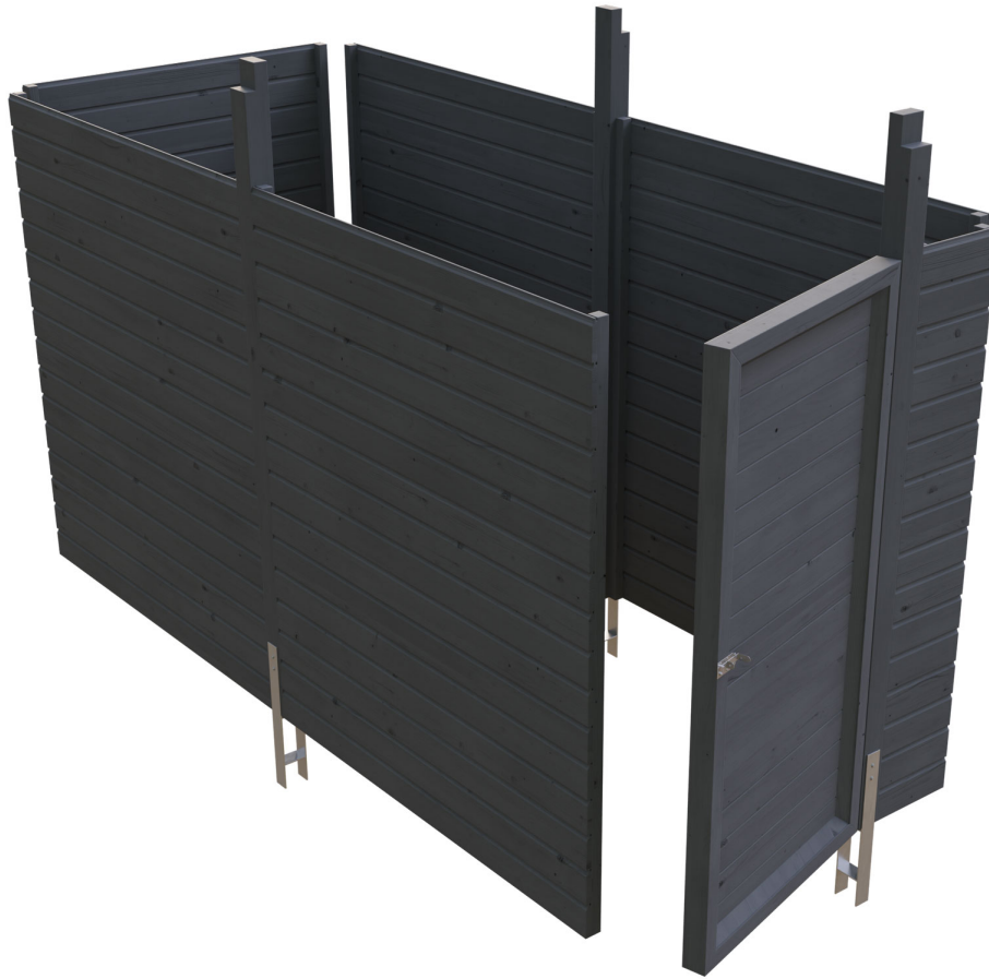
Produktbild Abstellraum C1