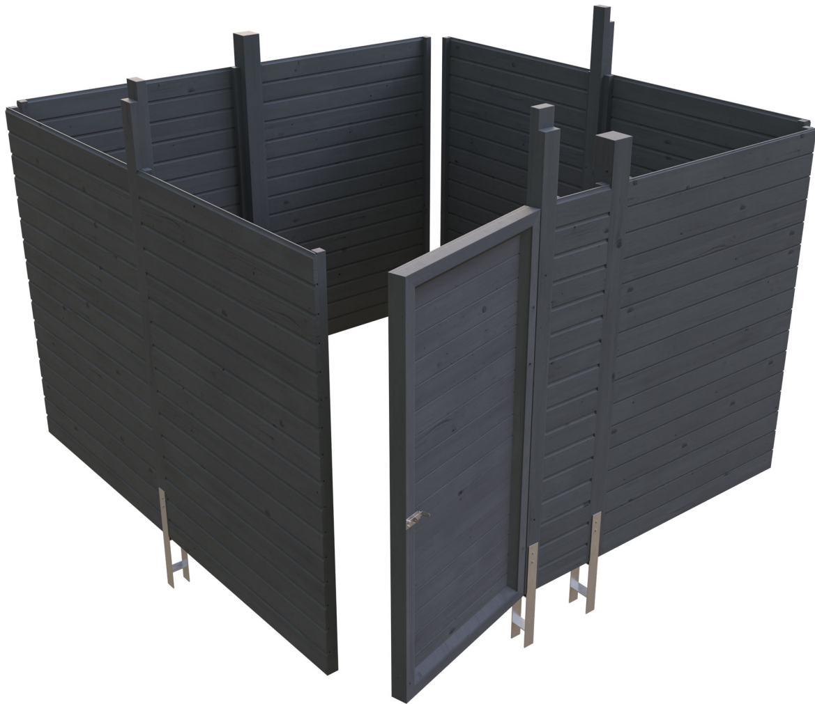
Produktbild Abstellraum C2