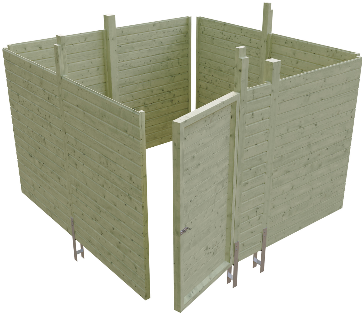
Produktbild Abstellraum C2