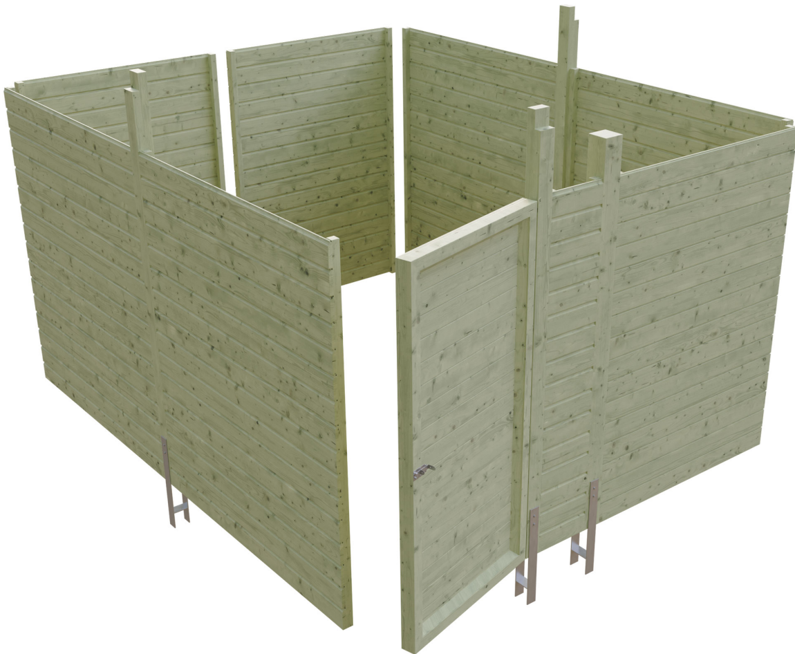
Produktbild Abstellraum C4