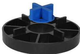
Abbildung 3: Einlegen von FK-B in Volfiteller stapelbar für höhere Aufbauhöhen

Gegebenenfalls ist ein festes Verbinden der Elemente z.B. durch Kleben bauseits erforderlich.