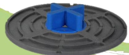
Abbildung 2: gummierte Volfiplatte VP-GKU 0/00 als verbreiterte Auflagefläche für FK-B