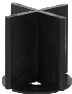
Abbildung 5: extra hohes Fugenkreuz mit Bodenplatte (52mm Fugenhöhe)

Ab einer Stückzahl von 40.000 Stück sind Sonderfarben nach RAL auf Anfrage lieferbar. Gegen geringen Aufschlag sind auch individuelle Verpackungseinheiten möglich. Aufgrund der vollautomatischen Verpackungsanlage wird innerhalb weniger Werkzeuge geliefert. VOLFI Fugenkreuze werden in eigener Produktion in Deutschland gefertigt und stehen seit vielen Jahren für Qualität und Genauigkeit.