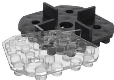
Abbildung 3: TK-U 4/10 im Vergleich zu WK-U 4/10

Für gleichmäßige Fugen im Wandbereich wird der Wandabstandhalter WAE-K mit Klemmnase genutzt. Zusätzlich verhindert er ein „Kippen“ der Platten an der Wand.