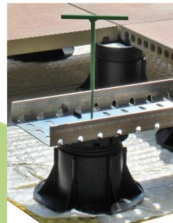
Abbildung 6: Kastenrinne aufgestellt auf Stelzlager SK-V durch Volfiteller VT-B 4/10 als Adapter mit eingesetztem VOLFI Stellschlüssel zur nachträglichen Feinjustierung.