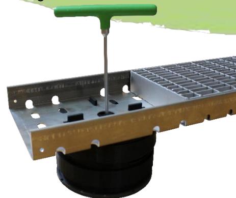
Abbildung 3: VOLFI Gitterrost mit Kastenrinne aufgesetzt auf TL-V Stelzlager