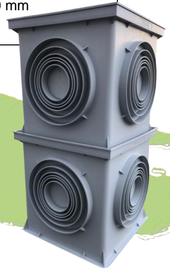
Abbildung 2: Revisionsschacht DP-FS gestapelt