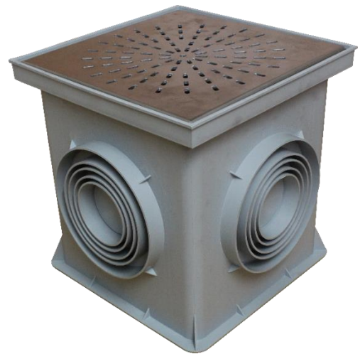
Abbildung 1: Revisions-/Kontrollschacht DP-FS mit eingelegter Drainageplatte DP-AF3

Zusätzlich ist der DP-FS 100% korrosionsfrei, streusalzbeständig, farbecht (UV stabilisiert) und außerdem leicht zu montieren.