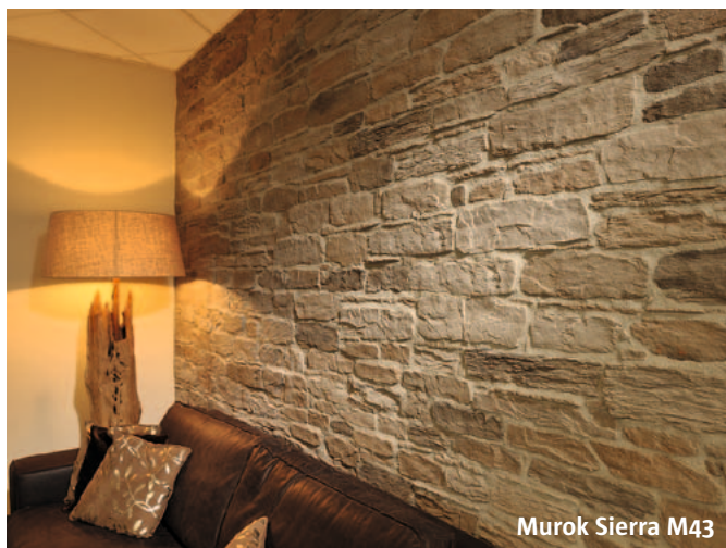
Murok Sierra M43

Endverarbeitungsstücke und Ausgleichsstücke für den Höhenausgleich sind für die Serie Murok Montana erhältlich, und den Eckenkartons beigelegt.