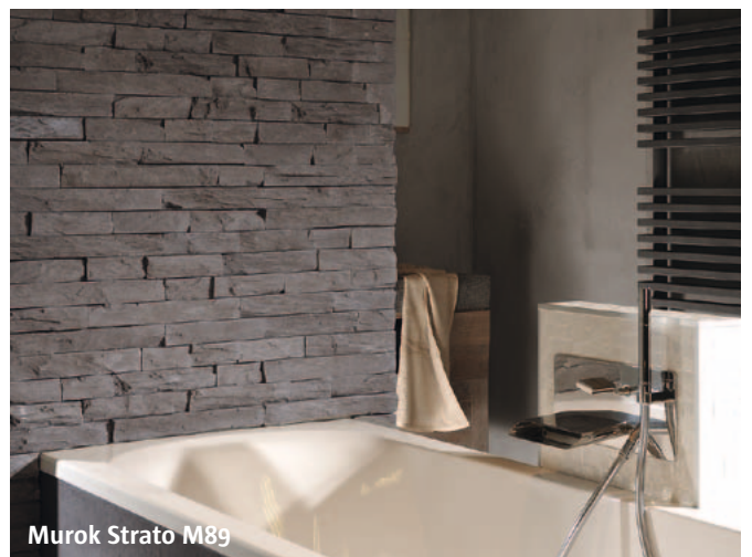
Murok Strato M89